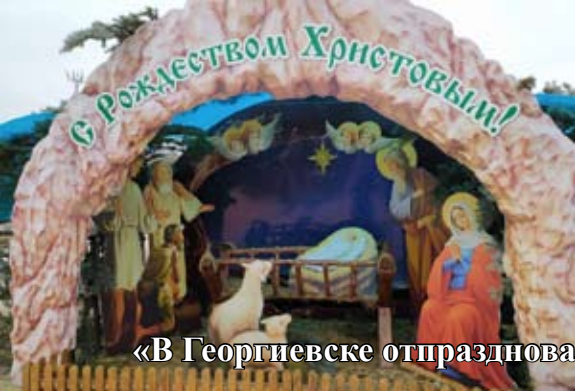
Фотоиллюстрации к статье «В Георгиевске отпраздновали Рождество Христово» (стр. 14)