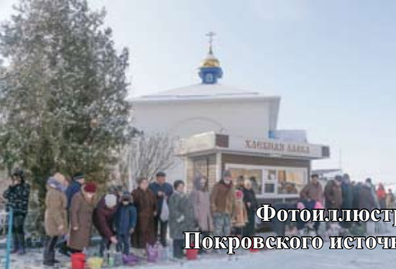
Фотоиллюстрации к статье «Освящение воды Покровского источника станицы Урухской» (стр. 17)