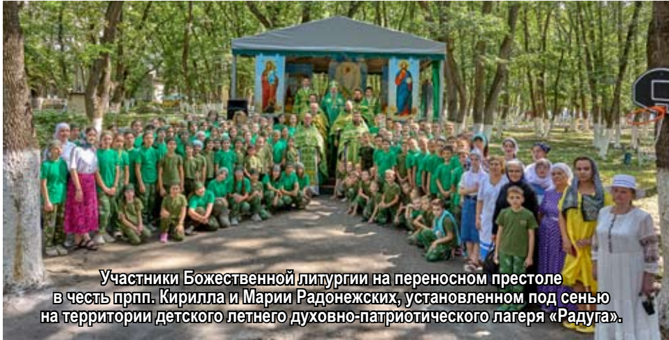
Участники Божественной литургии на переносном престоле в честь прпп. Кирилла и Марии Радонежских, установленном под сенью на территории детского летнего духовно-патриотического лагеря «Радуга».

В последние дни августа успешно завершился очередной сезон работы детского летнего духовно-патриотического лагеря «Радуга», действующего на территории Архирейского подворья при храме-часовне преподобного Сергия Радонежского в станице Незлобной.